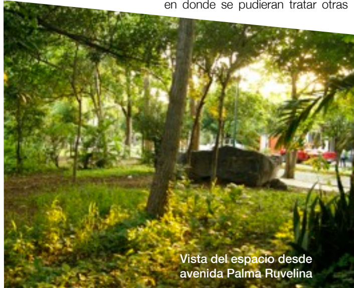
Vista del espacio desde avenida Palma Ruvelina