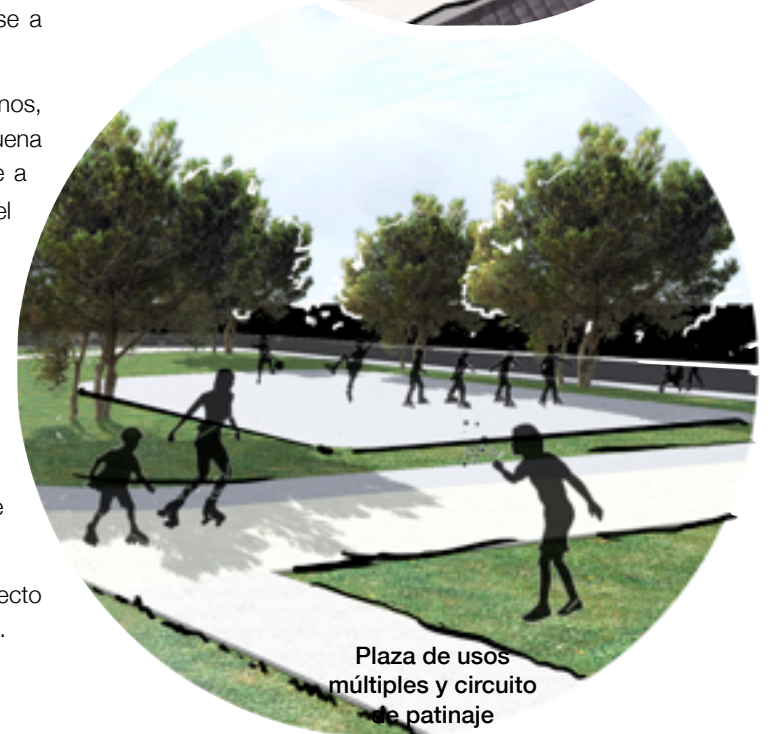
Plaza de usos múltiples y circuito de patinaje