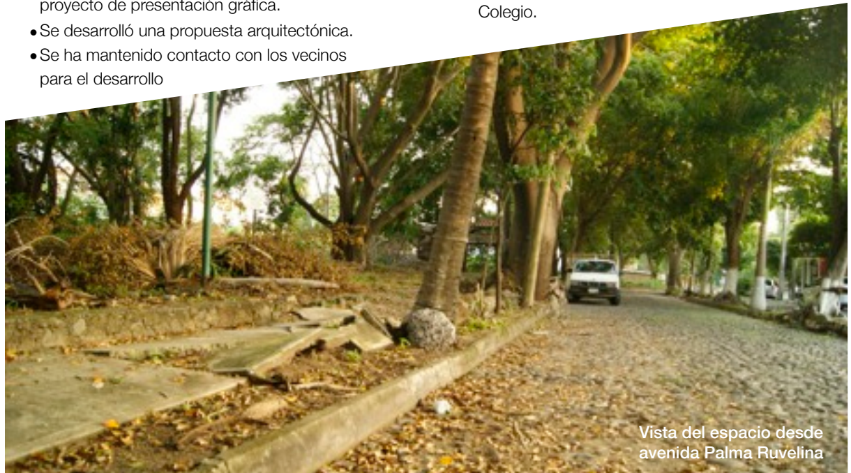
Vista del espacio desde avenida Palma Ruvelina