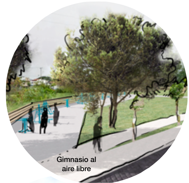
Gimnasio al aire libre

Nota: para conocer más información sobre el proyecto se adjuntan las láminas de presentación del mismo.