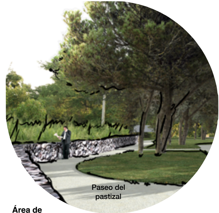
Paseo del pastizal

Vinculado al gimnasio, se proyectan dos explanadas de pasto, para la realización de actividades como yoga o juegos sobre el mismo.