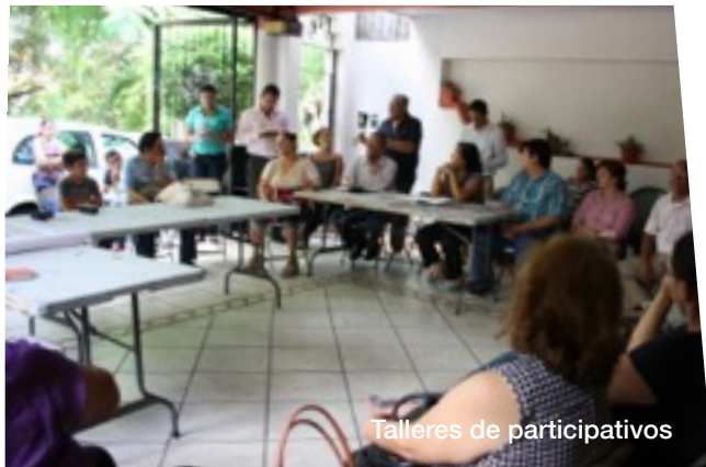
Talleres de participativos

Durante los talleres se pudo evidenciar que los vecinos buscan un alto sentido de protección por la conservación del medio natural que existe, principalmente quienes tienen relación directa con el espacio, por lo que la fauna y flora del lugar son elementos muy importantes para ellos y por tanto, actores a cuidar y proteger para el proyecto.