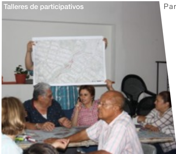
Talleres de participativos