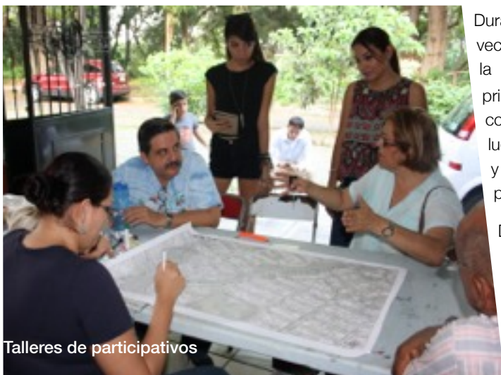
Talleres de participativos

“Imagino un lugar ecológico que respeta la flora y fauna”